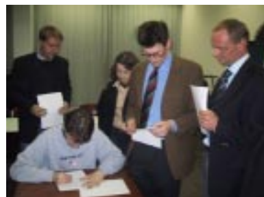
Die Stimmenauszählung für die Delegierten zum Landesparteitag. Dank an alle Zählkommissionen. Ohne sie wäre der Parteitag nicht so zügig verlaufen.