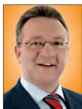
Frank Henkel, MdA Landes- und Fraktionsvorsitzender, Lic. rer. publ., Diplom- Kaufmann, Groß- und Außenhandelskaufmann www.henkel-cdu.de

Bürgersprechstunden der Abgeordneten aus Mitte