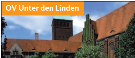
OV Unter den Linden